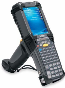
Motorola MC9090 scanner, som Maskinhandler Indkøbsringen benytter.

MI valgte løsningen fra Tasklet, men fordi man allerede havde været i gang med at se på andre produkter, var der indledningsvis nogle forhindringer, der skulle forceres: